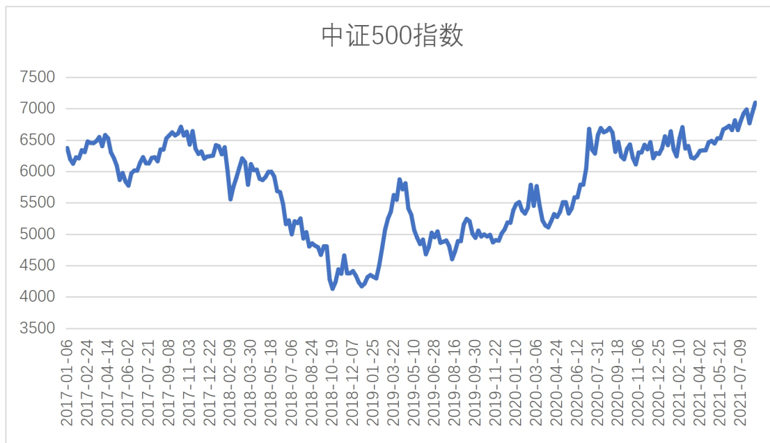
图 3-中证 500 指数市场表现